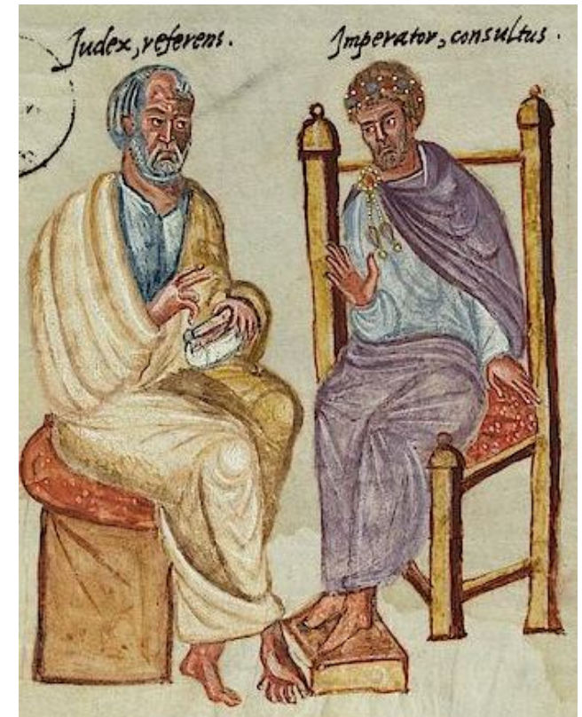
Pal. lat. 1564, fol. 3 r